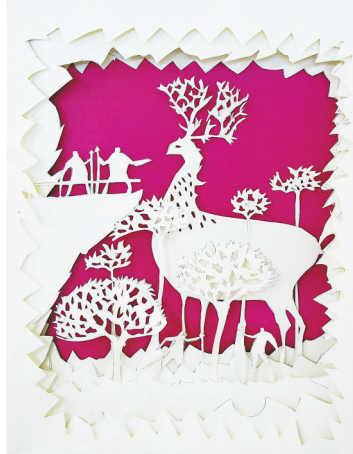
作品名称:《猎人与鹿》 作品类别:纸雕 作者姓名:李颖 倪晓汇 张静 包蓓蓓 班级:学前3-1603 指导教师:高晓丽 创作思路:还原了原始森林里,原住民和鹿之间的战争