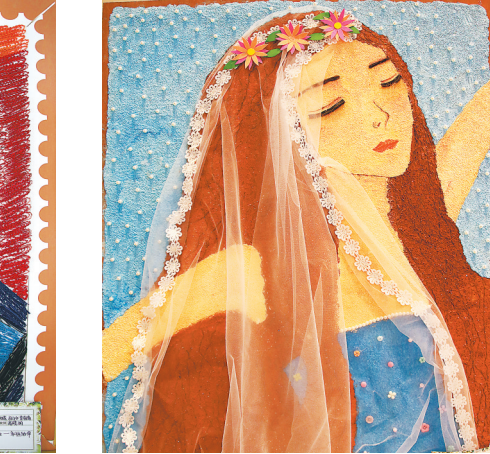
作品名称:《沙滩美女》 作品类别:纸浆画 作者姓名:张露露 班奕奕 刘亭亭 鲁甜 李文慧 吴静 李颖 班级:学前3-1603 指导教师:高晓丽 创作思路:夏日炎炎,沙滩边美女享受日光

(上接第三版)其实,在推动“荞麦+文化旅游”这条路上,高立荣一直都是最虔诚的荞麦文化传播者。在靖边县东坑镇荞麦文化旅游园,他亲自设计,将荞麦与文化相联系,只要关于荞麦的历史、传说、歌曲、诗作、朗诵,他都会不遗余力地收集起来,组织人员进行推广和传播:“黄梅戏《打猪草-对花》的唱词,丢下一颗籽,发了一个芽,红秆子绿叶,开的是白花,结果的是黑籽,此花就是荞麦花。唐代白居易还有“独出门前望田野,月明荞麦花如雪”的名句……”说起荞麦,高立荣如数家珍,甚至连饮食都不放过,“吃一碗荞麦凉粉吧,味道好