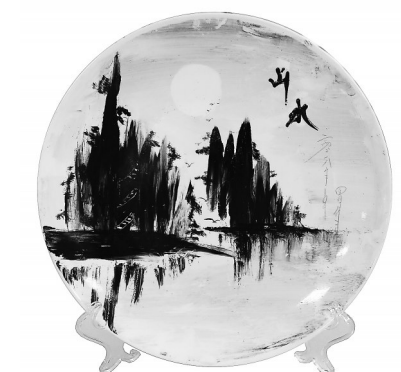
作品名称:《高山流水》 作者姓名:许盈霞 作品类别:盘绘 指导教师:高晓丽 班级:学前3-1605 创作思路:象征大自然生机的斑斑墨迹