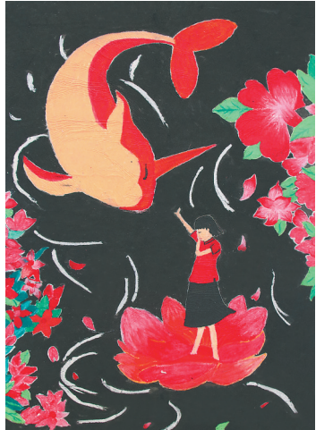
作品名称:《大鱼海棠》 作品类别:蜡笔画 作者姓名:盛荣菲 王彩云 马艳男 指导教师:高晓丽 班级:学前3-1602 创作思路:北冥有鱼,其名为鲲,鲲之大不知其几千里也。