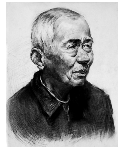
作品名称:《老人》 作者姓名:高莉雪 作品类别:素描 指导教师:高晓丽 班级:学前3-1602班 创作思路:表达对爷爷满满的爱意