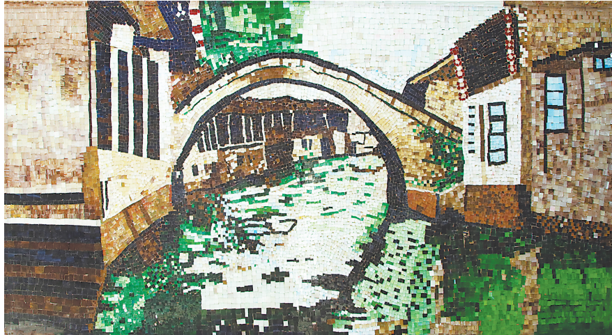
作品名称:《小桥流水》 作者姓名:3-1601班二组 班级:学前3-1601 指导教师:高晓丽 作品类别:马赛克拼贴 创作思路:取自烟雨江南之景,尽显诗情画意