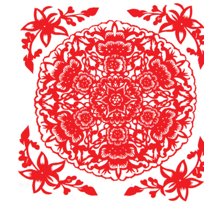
作品名称:《团之花》 作品类别:剪纸 作者姓名:孙改霞 廷慧卿 郭娜 魏晓彦 李乐乐 班级:学前3-1607 指导教师:李晚霞 创作思路:象征圆满完整、十全十美、吉祥如意。