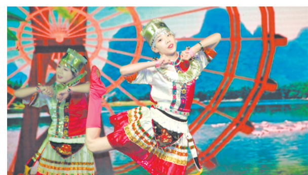
2018届毕业生晚会暨第五届校园文化艺术节颁奖晚会

晚会节目丰富多彩,充满了青春气息。伴随着精彩纷呈的节目表演,晚会公布了各类奖项,观看晚会的院