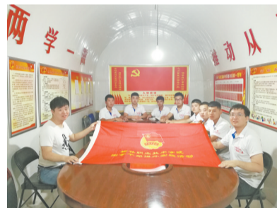
温暖留守儿童 慰问孤寡老人

习近平总书记曾说过:有信心、有梦想、有奋斗、有奉献的人生,才是有意义的人生。只有把人生理想融入国家和民族的事业中,才能最终成就一番事业。为了更好地教育广大青年学子,帮助他们了解社会、了解国情,树立正确的世界观、人生观、价值观,响应国家“助力脱贫攻坚,决胜全面小康”号召。近日,榆林职业技术学院师生一行9人深入我县寇家塬镇车家塬小学开展了为期7天,包括精准扶贫调研、特色支教、关爱孤寡老人与留守儿童等在内的暑期社会实践志愿服务活动。